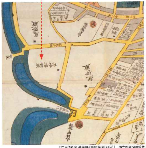
「江戸切絵図 外桜田永田町絵図(部分)」