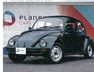
↑賞品は、2001年モデルの『フォルクスワーゲン ビートル』。エンジン発動で機関良好だ。応募締切は4月18日。

の『フォルクスワーゲン ビートル』が抽選で1名に当たるキャンペーンを実施中だ。“いいね!” ボタンを押すだけで当たるかもしれないなんて太っ腹だね。名車を手にするチャンスだけに、ふるって応募しよう。