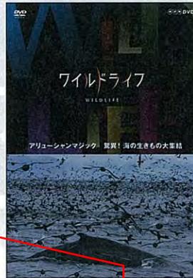
←特典映像として、スペクタクル映像集 (BGV) と番組予告集を収録。価格はDVD版2940円、ブルーレイ版3465円。

ンマジック』、『オーストラリア メルボルンの海』、『大西洋 フォークランド諸島』の3作品だ。今回は本作品の発売を記念して、『アリューシャンマジック』のDVDをプレゼント! 応募方法は139ページを参照。