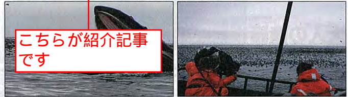
こちらが紹介記事です