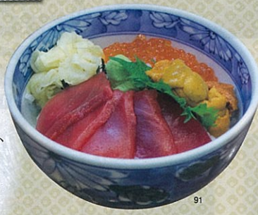
三種盛丼(まぐろ・うに・いくら)

営業/5:00～15:30、定休日:無休 季節の海鮮丼1,500円～、三種盛丼(まぐろ・うに・いくら)900円～