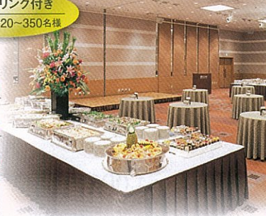
※プランに含まれるものは、お料理、フリードリンク、室料です。

◆5~19名様でご利用いただける少人数個室プラン(2時間¥5,000~)もございます。 ◆ダイニング&バー ウイステリア、日本料理 館処 桂でもお得なプランをご用意しております。詳しくはお問い合わせください。