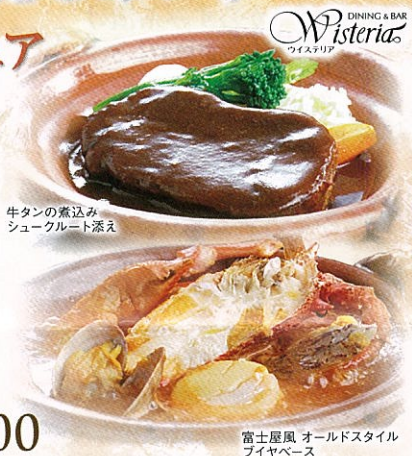
牛タンの煮込み シュクルート添え

富士屋ホテル伝統のじっくり煮こんだ コクのあるビーフシチューや、 独自のレシピで作るオールドスタイルの ブイヤベースはいかがですか?