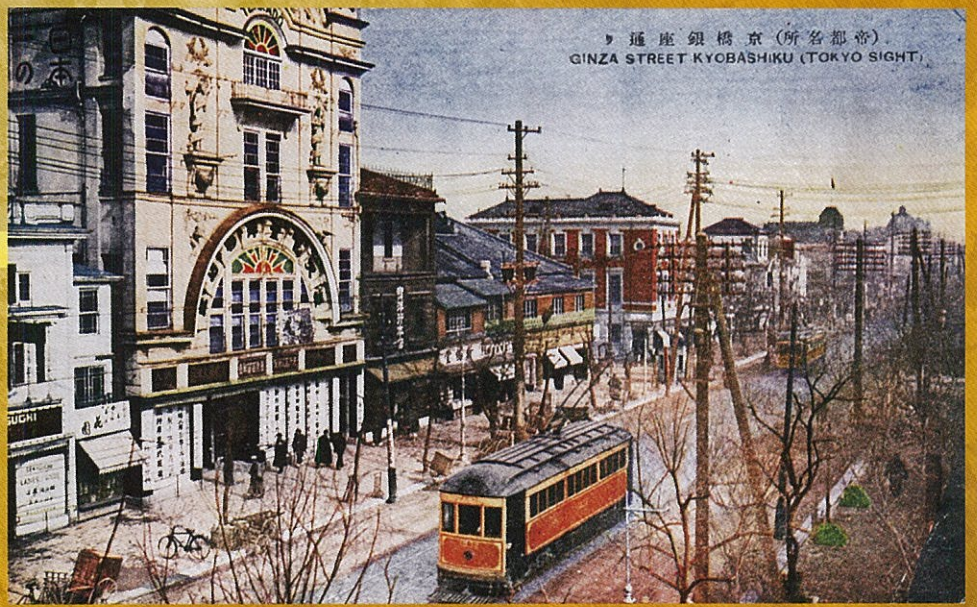
銀座街 京橋銀座通り (所名都帝) GINZA STREET KYOBASHIKU (TOKYO SIGHT)

(帝都名所)京橋銀座通り 中央区立郷土天文館「タイムドーム明石」所蔵 大正時代の銀座7・8丁目です。