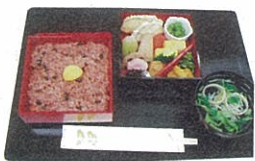
榮太樓總本舗の「お赤飯お重」

日本橋川をたっぷり堪能できる60分間のクルーズと日本橋周辺の歴史散策、榮太樓總本舗でのランチがセットになった体験ツアー。スケジュールや料金など、詳しくは電話かWEBサイトで問い合わせを(要予約)。