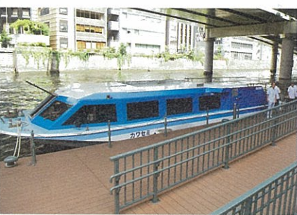
日本橋船着場と水上バス「カワセミ」

運航の有無や運賃、時刻表など、詳しくは電話かWEBサイトで確認を。定期便、不定期便とも予約は不可。発売日のみ有効の乗船券を直接発着場にて購入のこと。