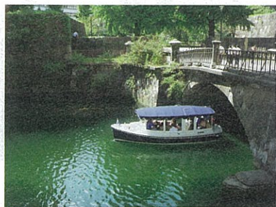
常盤橋と10名乗りの電気ボート

●お問い合わせ・お申し込み…江戸東京再発見コンソーシアム舟めぐり事務局 / TEL 03-3668-0700 / 営業時間…平日9:00~12:00、13:00~17:00 / 土曜・日曜・祝日休 www.edo-tokyo.info/ship/course_01.html