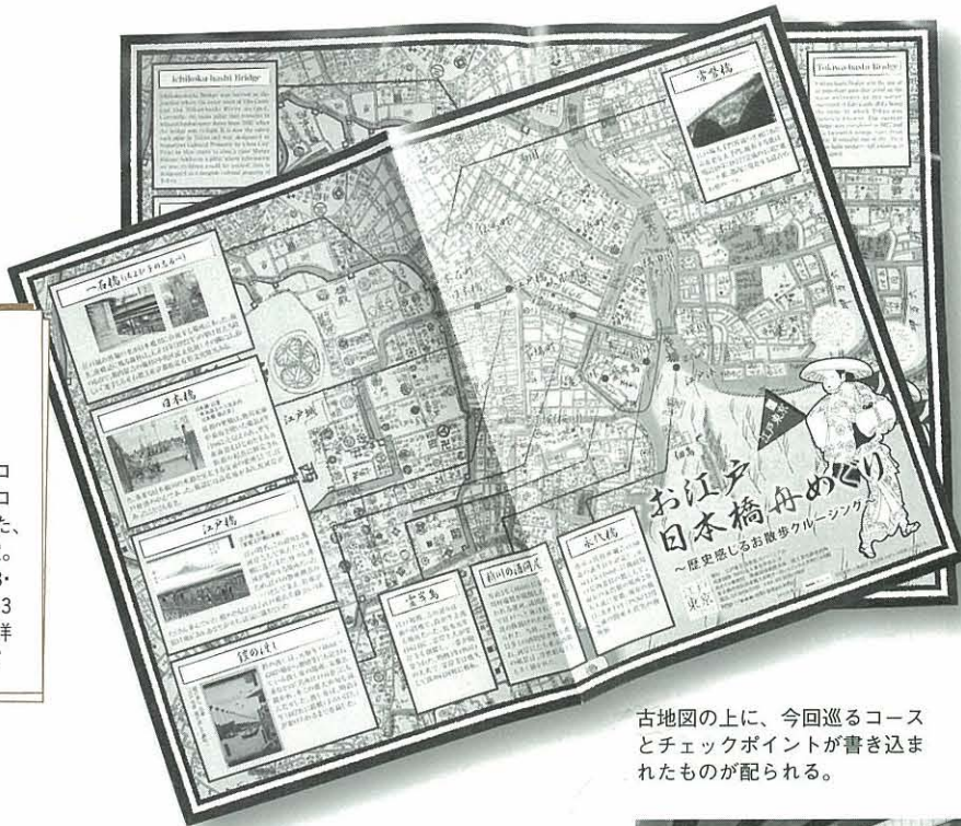
古地図の上に、今回巡るコースとチェックポイントが書き込まれたものが配られる。

DATA 発着場所: 日本橋船着場 日時: 7月18・20日、8月15・18・20日(10時、12時、14時30分の3回) 費用: 2,500円※以上、日本橋川コースの詳細) 予約優先 http://www.edo-tokyo.info/