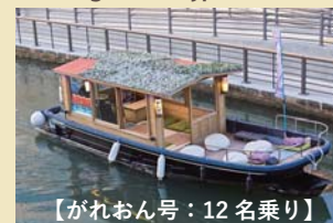
【がれおん号：12名乗り】

環境や人に優しい静かでエコな電気ボート。歩く速さで江戸東京を再発見。歴史を感じるお散歩クルージング。チャーターも可能。