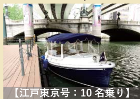
【江戸東京号：10名乗り】