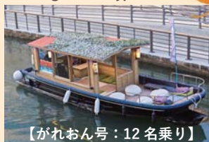
【がれおん号：12名乗り】

重要文化財の補修も手がける船大工が作ったこだわりの木造お屋形と開放的なデッキを備えたくつろぎのお座敷船です。