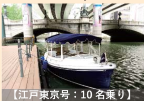
【江戸東京号：10名乗り】

環境や人に優しい静かでエコな電気ボート。歩く速さで江戸東京を再発見。歴史を感じるお散歩クルージング。チャーターも可能。