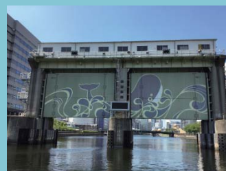
天王洲エリアを水辺から眺めるミニクルーズ