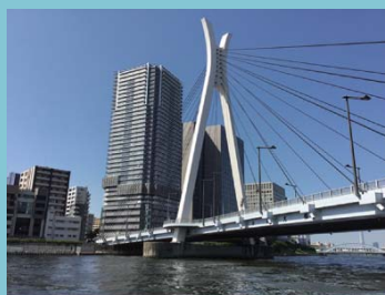
日本橋から天王洲へ東京のウォーターフロントをたどります